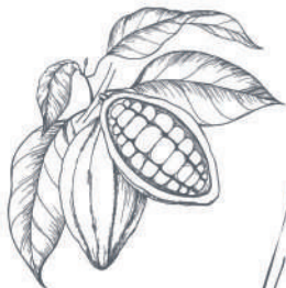
Cabosse de Cacao