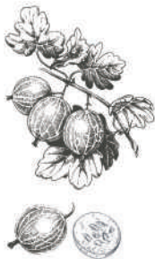
Groseille à maquereaux