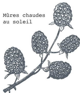
Mûres chaudes au soleil